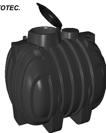
PROLUNGA MODULARE OPZIONALE (mod. PP75)