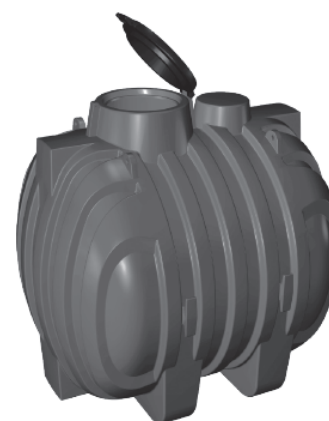
PROLUNGA MODULARE OPZIONALE (mod. PP75)