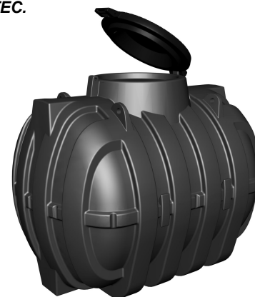
PROLUNGA MODULARE OPZIONALE (mod. PP75)