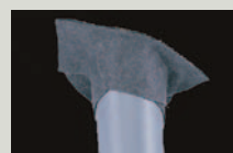
DELTA®-FLEXX-BAND Banda adesiva estensibile larghezza 100 mm.