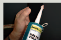
DELTA®-TIXX Colla in cartuccia per la sigillatura.